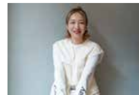
SCENE by RAD 水口英里

様々なセミナーがあるなか、その分野に特化した講師をご用意。トップスタイリストとして今も走り続ける技術力を直接学ぶことができます。