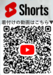
Shorts 着付けの動画はこちら▼

着物は特別な日に着ることが多いのでお客様の大切な日に立ち会える素敵な仕事です。ヘア、メイク、着付けに全て担当出来ることは強みだと思います!