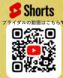
Shorts ブライダルの動画はこちら▼